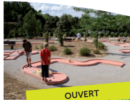
MINI GOLF ▶

La gestion du complexe de Loisirs Raymond Chesa (Lac de la Cavayère) relève d'une compétence communautaire. L'Agglo entretient les espaces, les équipements publics, le barrage et gère les activités privées présentes sur le site.