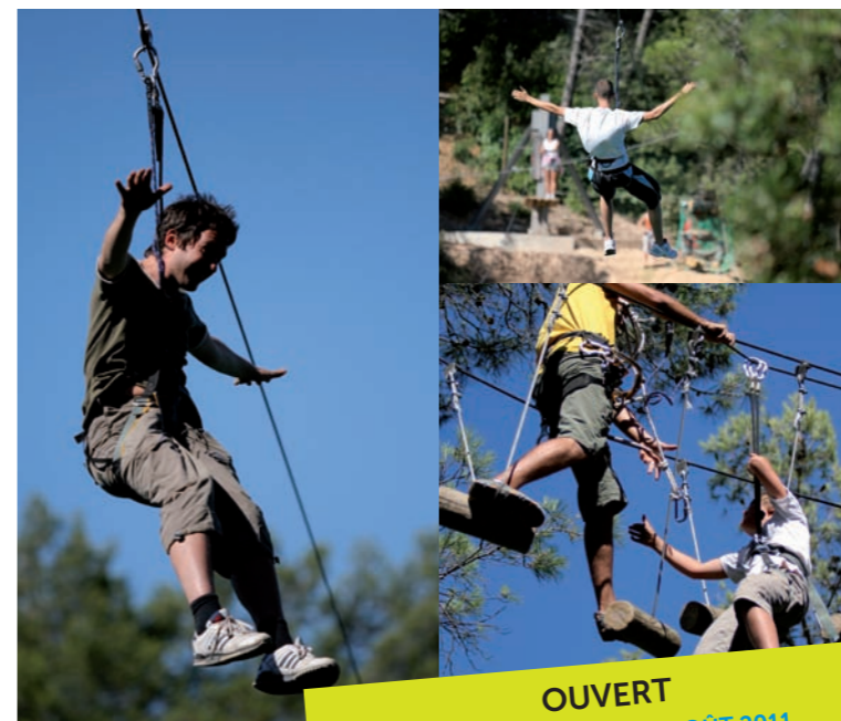
▼ PARC ACROBATIQUE FORESTIER

OUVERT DU 1 ER JUILLET AU 31 AOÛT 2011 7 JOURS SUR 7 - DE 13H À 19H (DERNIER DÉPART) Le matin sur réservation www.o2aventure.com Localisation (7.2 en hauteur et 3.7 en largeur)