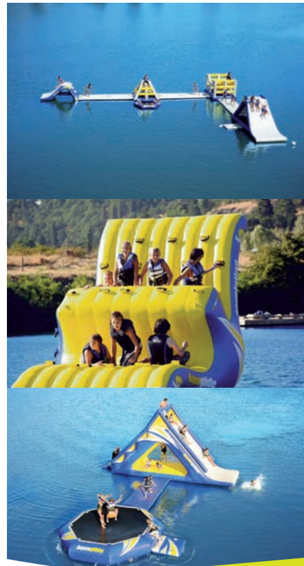
▼ PARC AQUAVIVA

OUVERT DU 1 ER JUILLET AU 31 AOÛT 2011 7 JOURS SUR 7 - DE 13H À 19H