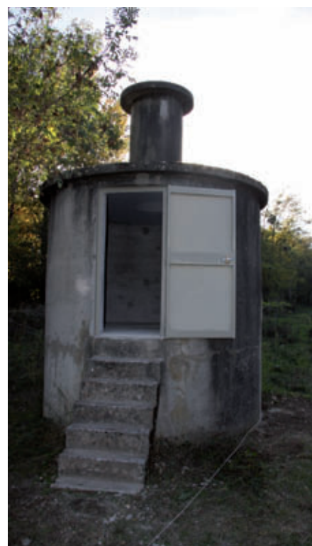
Détecteur anti-pollution à Couffoulens

dans le but de prévenir de toute pollution grave qui affecterait ces eaux, il a été convenu d'installer un dispositif de détection en amont des captages, au lieu-dit "L'Origine" sur la commune de Couffoulens. Le coût des travaux pour cette station d'alerte est de 5 630 € HT.