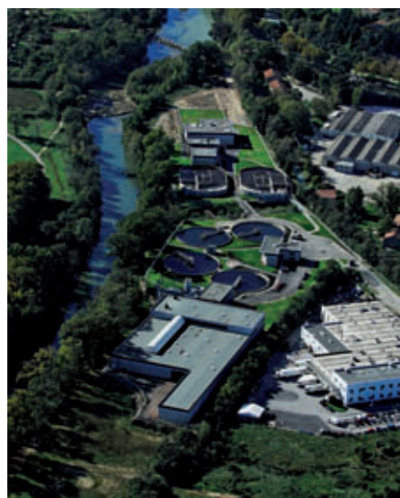
Station d'épuration Saint-Jean à Carcassonne