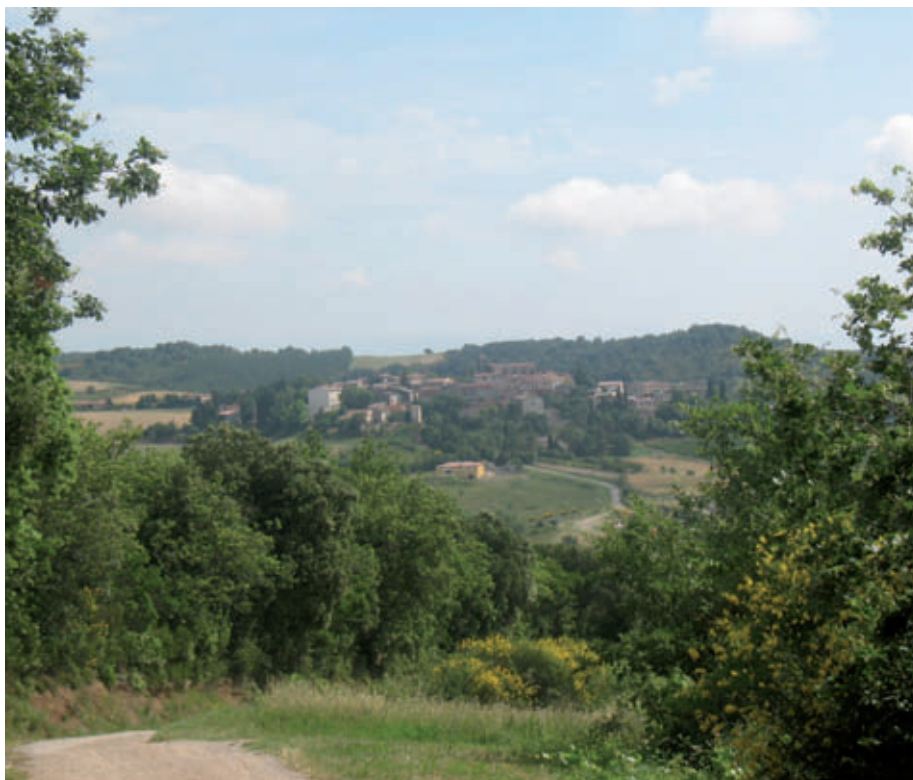
Vue sur la commune de Montclar

Ces travaux sont régulièrement réalisés pour faciliter l'évacuation des eaux et éviter l'érosion des berges entraînant d'importants dégâts lors des débordements ou des ruptures de digues.