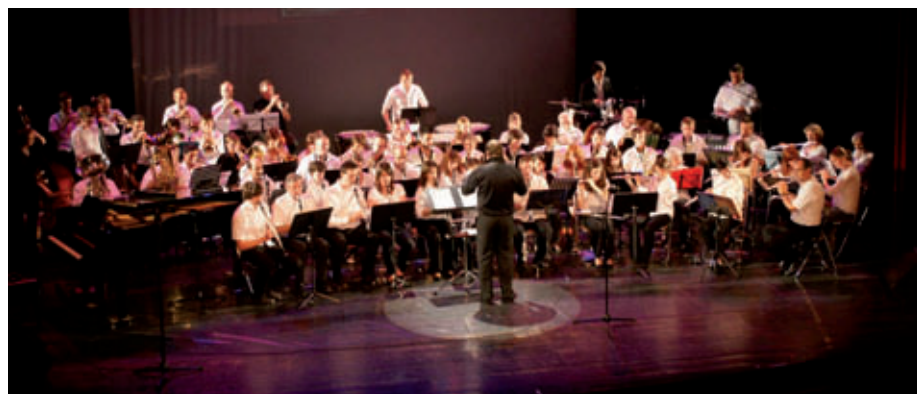
Orchestre d'Harmonie et solistes

Chansons contemporaines de compositeurs français - compositions du folklore anglais et XX ème siècle.