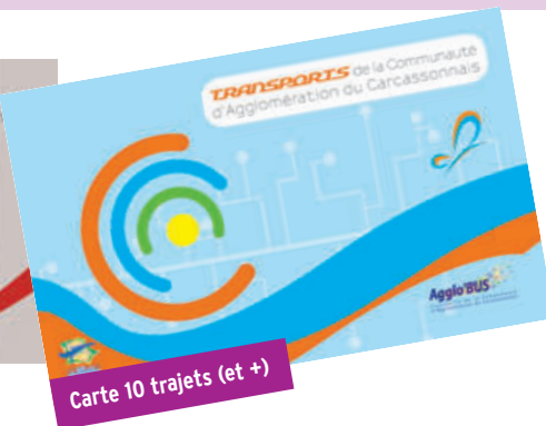
Carte 10 trajets (et +)