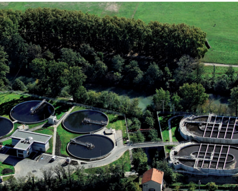
Station d'épuration Saint-Jean à Carcassonne