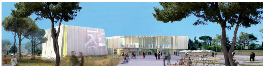
Le futur Conservatoire : un bâtiment à consommation énergétique optimisée

Depuis sa création, l'Agglo a démontré sa volonté d'agir en faveur de la protection de l'environnement de son territoire à travers différentes actions : achat de véhicules propres pour les transports en commun, politique de prévention des inondations,